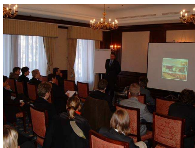
Bezoek Conrad Hotel